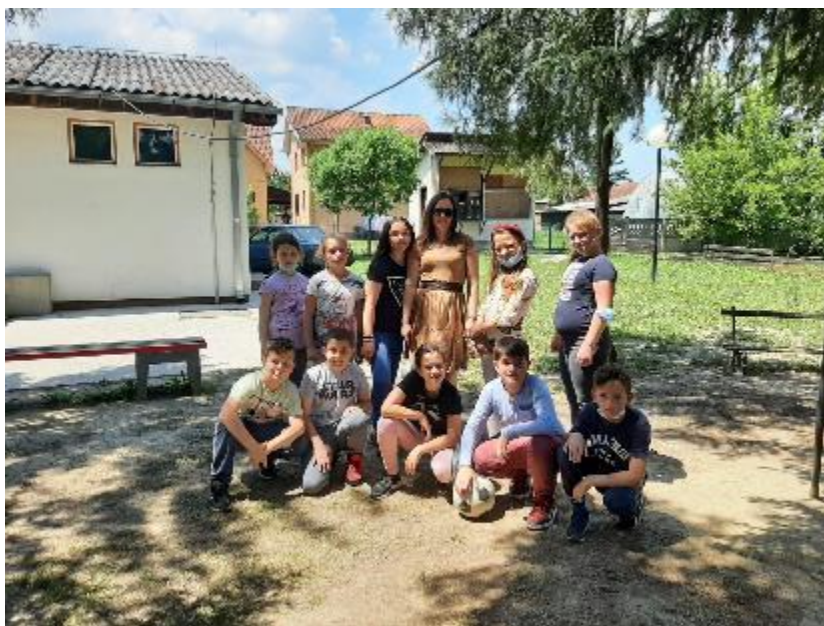
Последњи дани у овој школској години