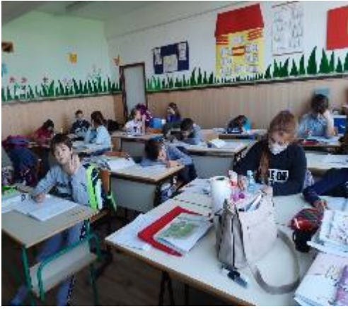
Израда домаћих задатака