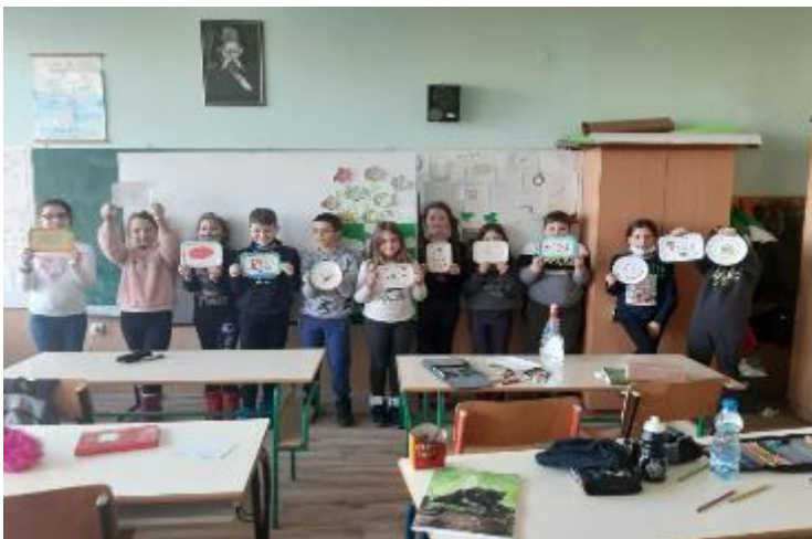
Цртање омиљеног здравог оброка