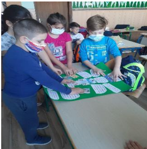
Израда панона о превентивним мерама против вируса „Корона“