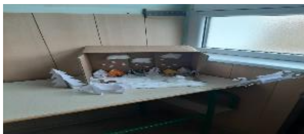
Израда зимског кутка у нашој учионици