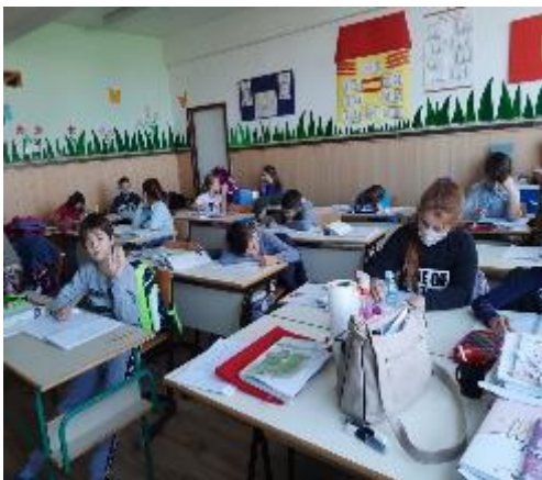
Израда домаћих задатака