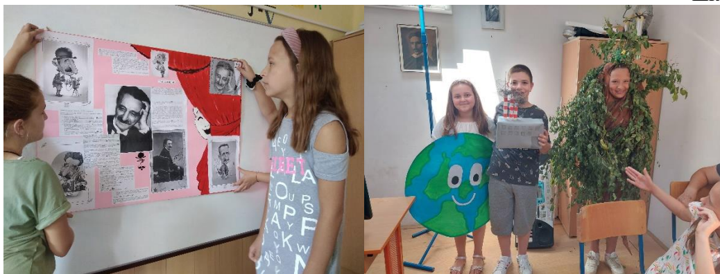
Представљање знаменитих личности. Одељењска приредба за крај школске године.