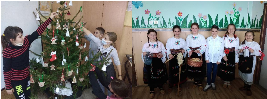
Припрема сцене за Нову годину. Драматизације песме „Зравица“ за Дан школе.

Током школске године ученици су припремили приредбу за Нову годину, Осми март и за крај школске године, а учествовали су на приредби поводом Дана школе. Урађене су драматизације многих песама и извођени многи драмски текстови.