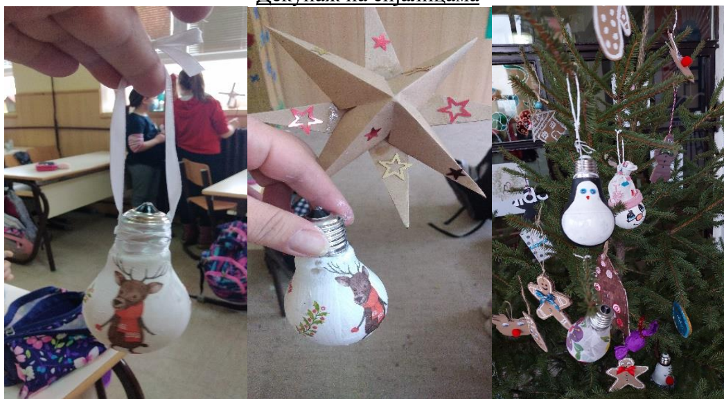
Декупаж на сијалицама