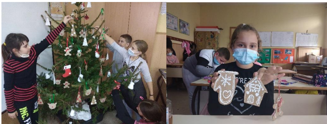
Украси за новогодишњу јелку