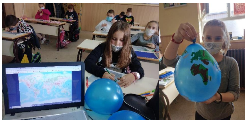
Глобус од балона