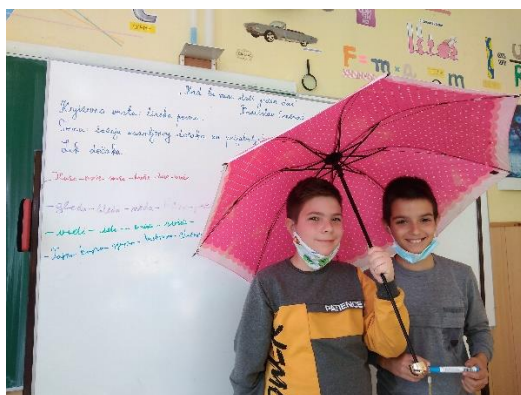
Драматизација песме „Кад би мени дали“ поводом Дечје недеље.

Доказано је да се дете у ваннаставним активностима потврђује као стваралац, а кроз емотивну ангажованост у драми касније показује боље успехе у учењу и памћењу стичући способност флексибилне и стваралачке личности.